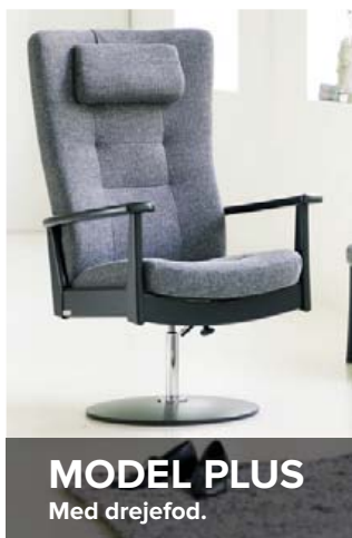
MODEL PLUS Med drejefod.