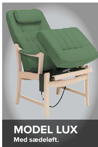
MODEL LUX Med sædeløft.