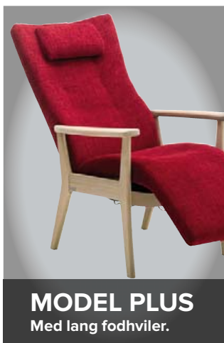
MODEL PLUS Med lang fodhviler.